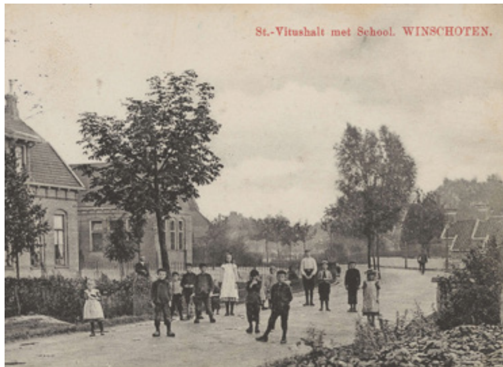
St. Vitusholt ca. 1910. De schoolmeesterswoning staat er nog

De weg lijkt nog steeds door of langs het 'voorheen een niet onaanzienlyk bosch' van meester