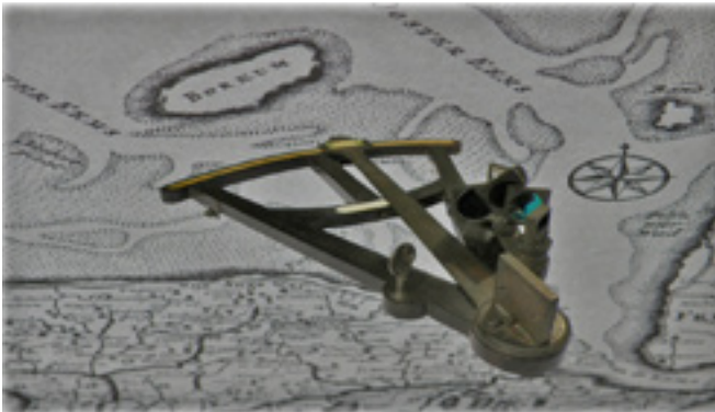
Octant van Luppo Stel

Het is inmiddels voltooid verleden tijd. Onze Groningse voorouders die met schepen tot 100 ton laadvermogen, geladen met turf uit de Veenkoloniën of steenkool en glaswerk uit Engeland naar de Oostzeelanden vertrokken. Om daarvandaan als kooplieden met een schip vol hout of graan terug te keren.