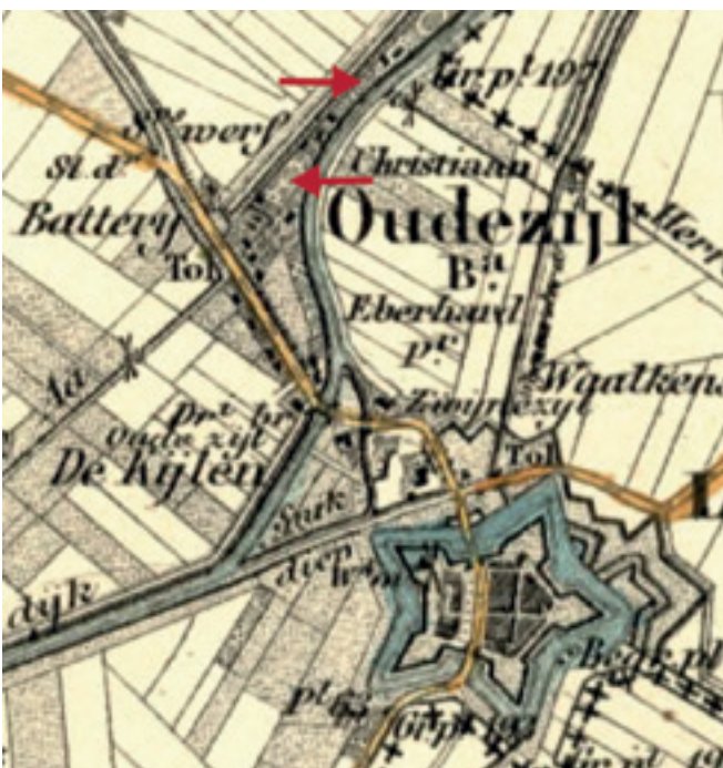
Scheepswerf bij bovenste pijl schuin tegenover de Rijkswatermolen

Het uitgebreide verhaal over deze zoektocht naar de familiegeschiedenis is beschikbaar op de website www.schanskerhistorie.nl bij laatste aanvullingen.