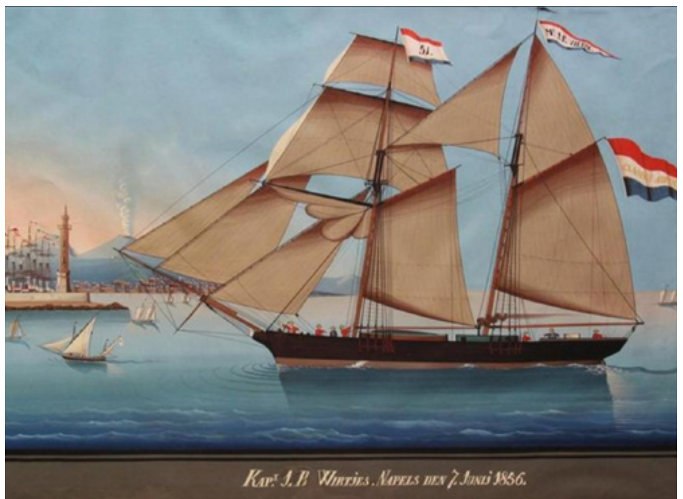
Het schip de ANNA in 1856