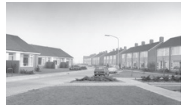
Charlottenstraat in 1973

Kun je je betere burens wens dan Christian Eberhard en zijn moeder Christine Charlotte? Niet vreemd dat er bij deze straten een Noaberpad naar de grens voert! Immers: een goede buur is beter dan een verre vriend.