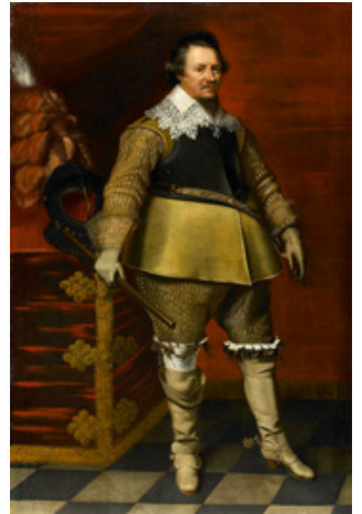
Ernst Casimir, graaf van Nassau-Dietz (Wybrand de Geest 1630/'35, collectie Rijksmuseum)

De ruimdenkende Charlotte laat haar zoon vanaf zijn zevende jaar reizen en opleidingen volgen in het buitenland, waaronder de Republiek der Zeven Verenigde Nederlanden. De ziekelijke Chris-