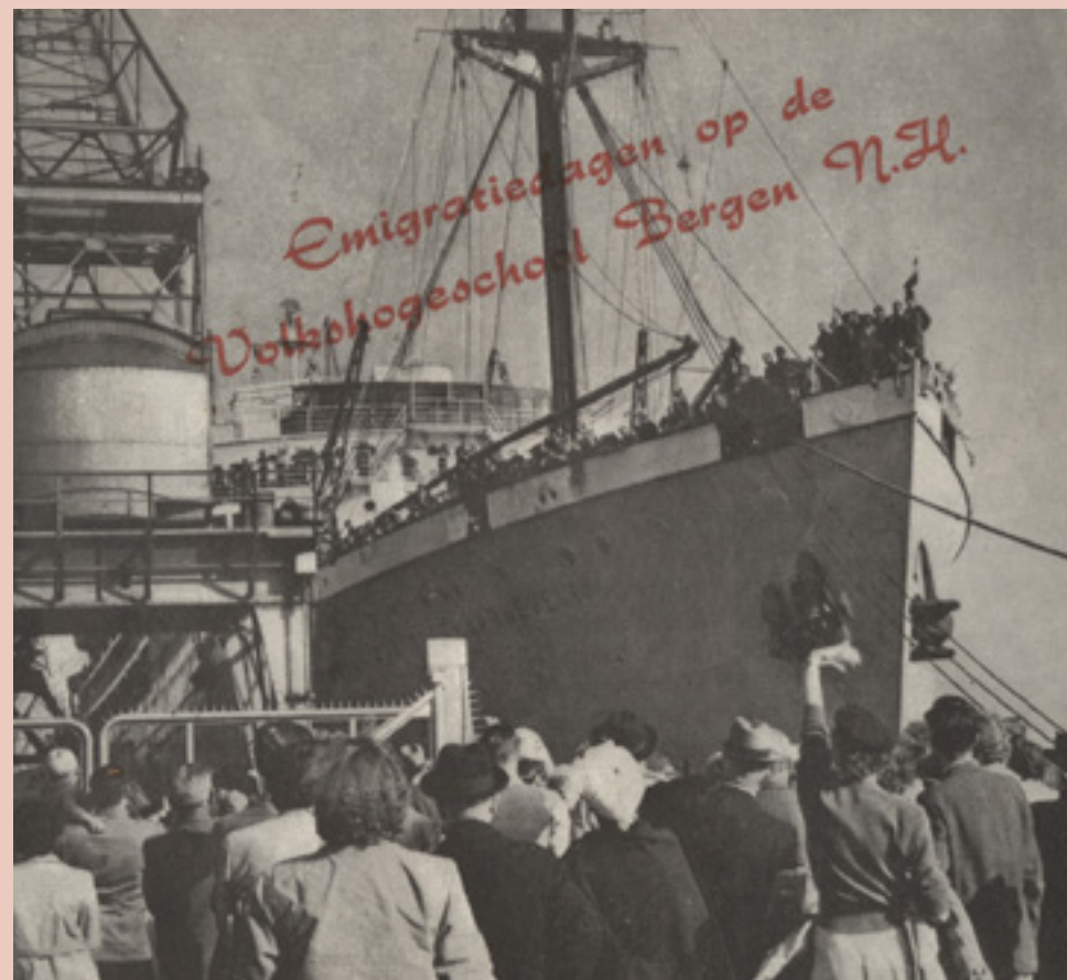
De uitnodiging van de Emigratiedagen in 1951

De zelfstandig emigrerende vrouw stond zelfs nog meer te wachten; haar eer was kwetsbaar en er was maar beperkt werk te vinden. Gevaar en onzekerheid zouden de vrouw meer raken, maar Winie hield altijd hoop op een goede afloop: "Vrouwen wacht geen gemakkelijke taak, als u houdt van uw gezin en gezond bent, van goede wil, dan zal tegenstand u niet verlammen, het onbekende u niet vijandig voorkomen, primitief leven niet ongeduldig maken, eenzaamheid u niet verruwen, het afscheid u niet onverschillig maken."