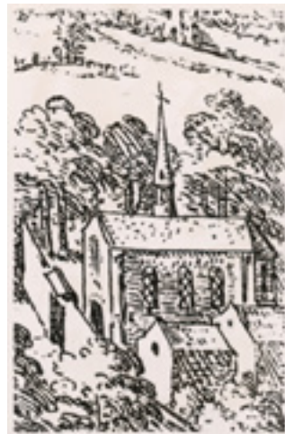
Prent van klooster Heiligerlee, ca. 1568