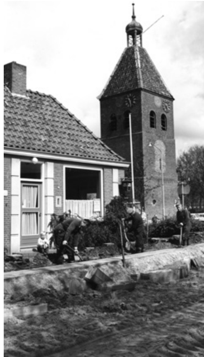
Aanleg van riolering op de hoek Hoofdstraat en Veenweg in Beerta

Het jaar 1983 lijkt laat, maar bijvoorbeeld aan de Utrechtse Oudegracht is het laatste pand pas in 1987 op de riolering aangesloten. In de jaren zeventig was het daar 'heerlijk toeven' aan de terrassen aan de werf met allerlei langsdrijvende uitwerpselen.