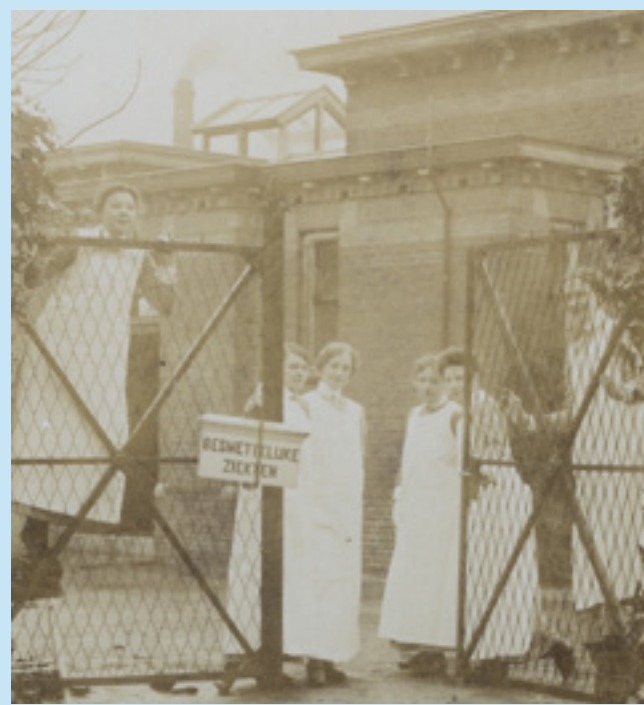
Academisch Ziekenhuis Groningen, 1915

in deze jaren ook het strijdtoneel van de Grote Noordse Oorlog. Je bemanning kon zomaar in de schermutselingen tussen Zweedse, Deense en Russische soldaten terecht komen. Hamburg en Bremen zaten vol oorlogsvluchtelingen en verschillende besmettelijke ziekten lagen op de loer. Een pokkenepidemie kostte in Bremen in 1711 zomaar het leven van bijna 1400 kinderen. Maar de epidemie die erop volgde, en die alle bovenbeschreven extreme maatregelen rechtvaardigde, zou nog veel maar slachtoffers maken. Zo konden in 1714 in Hamburg alleen al 10.000 extra doden genoteerd worden door deze vermoedelijk door Deense troepen meegebrachte ziekte. In de Middeleeuwen welbekend als 'de Zwarte Dood': het ging hier om de pest!