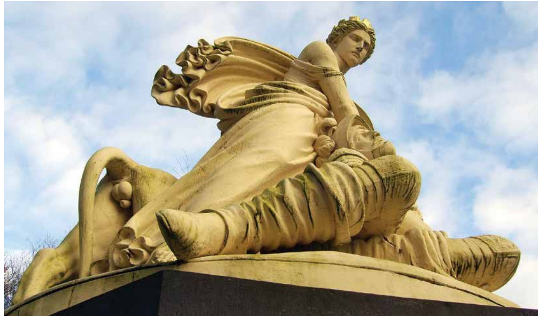
▲ Het beeld van graaf Adolf

Hier vond op de avond van de 23 e mei 1568 een treffen plaats tussen beide troepen. Enkele kenmerken van het terrein maakten het Lodewijk mogelijk een krijgslist toe te passen. De troepen van Aremberg werden door de cavalerie in een val gelokt. Dankzij het moerassige gebied waren ze een gemakkelijke prooi voor het geuzenleger. Ongeveer 1.500 Spaanse soldaten en 50 geuzen verloren het leven. Het paard