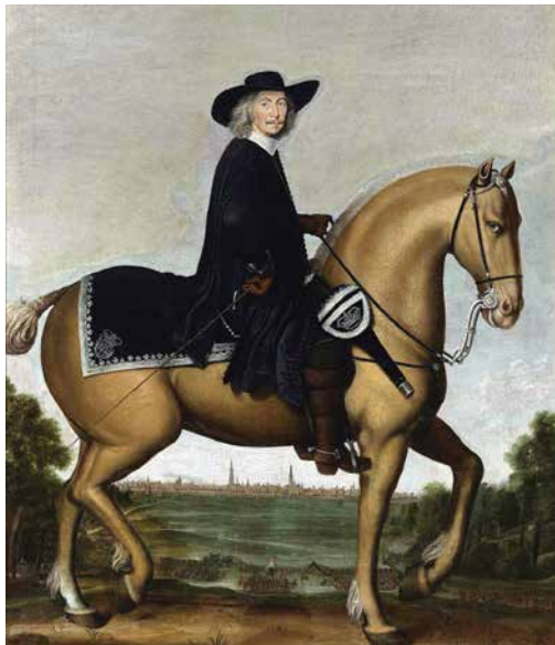
▲ Bernard van Galen

Op 13 september 1650 werd Christoph Bernard van Galen tot bisschop van Münster gekozen, amper 44 jaar oud. Van Galen deed er alles aan om protestantse gebieden terug te brengen onder katholieke invloeden. Mede door zijn vermeende aanspraken op de heerlijkheid Borculo deed hij eind september 1665 een inval in Oost-Nederland. Toen hij door Drenthe optrok naar het noorden zetten de Groningers met behulp van hun inundatiestelsel hele