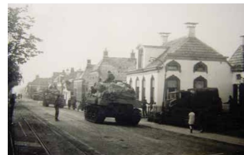
▲ Geallieerden in Oostwold

de helft van de gebouwen min of meer zwaar beschadigd; zo'n veertienhonderd gebouwen. De dorpskom van Woldendorp lag volledig in puin. In Termunten stond niet veel meer overeind: 49 huizen en boerderijen waren totaal verwoest en 470 waren zwaar beschadigd. De vele ontplofte granaten maakten de omringende landerijen tot ware mijnevelden. De wel ontplofte granaten hadden diepe kraters geslagen in het landschap.