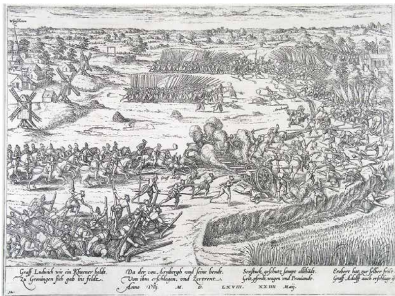
◀ De slag bij Heiligerlee (1568)

De Spaanse nederlaag bij Heiligerlee bleek van groot belang voor het moreel van de vaderlandse troepen en zette Heiligerlee definitief op de kaart. In 1826 werd ter herinnering een eenvoudige gedenknaald opgericht, die in 1873 werd vervangen door het huidige standbeeld, naar een ontwerp van J.H. Egenberger.