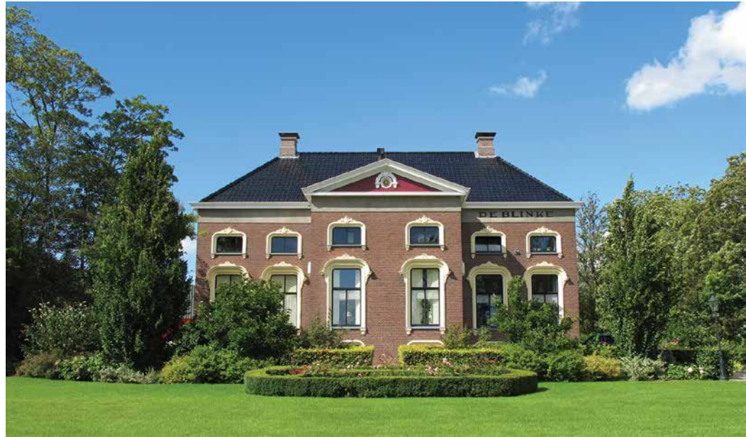
▲ Boerderij De Blinke

Door het bedijken van de nieuwe kwelders en het ontginnen van het hoogveen groeiden de boerenbedrijven. Kleine boeren die daar niet van wisten te profiteren, konden het niet meer bolwerken. De runderpest hakte er stevig in; telkens stierf een flink deel van de veestapel. De akkerbouw bood een aantrekkelijk alternatief, maar dan moest er wel geïnvesteerd worden in nieuwe landbouwwerktuigen,