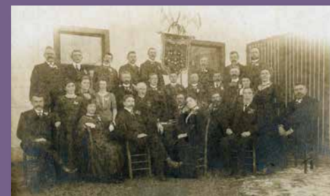
▲ Rederijderskamer de Vriendschap uit Finsterwolde (1895)

werd opgericht in 1822 onder het motto Nuttig niet alleen, maar ook vermaak meteen . In de notulen is nog altijd te lezen welke boeken en tijdschriften de leden voorgeschoteld kregen: vooruitstrevende geschriften over politiek en godsdienst en romans als De negerhut van oom Tom en Max Havelaar . Het gezelschap werd in 1972 opgeheven.