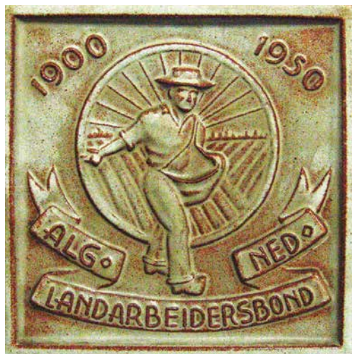
▲ Algemene Nederlandse Landarbeidersbond