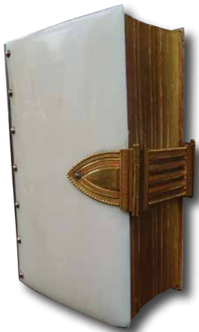
▲ Rijkdom: een bijbel met ivoor en goud

De Oldambtster boeren zijn niet altijd herenboeren geweest. En ze waren ook niet altijd zo vooruitstrevend. In de 17 e en 18 e eeuw waren de meeste boerenbedrijven vrij klein, gewoonlijk tien tot twintig hectare. Alleen de bedrijven in de nieuwe polders waren groter. Beleggers uit de stad die in land hadden geïnvesteerd, trokken aan de touwtjes. Het grootste deel van de bevolking was streng gelovig en oranjegezind. Ze rekenden erop dat de prins van Oranje hen zou beschermen tegen de vriendjespolitiek van de rijke stadsbestuurders en hun familieleden.