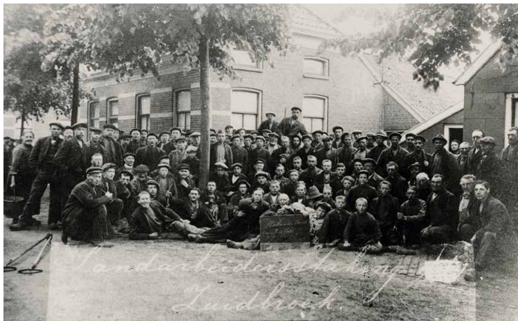
▲ De stakers uit Zuidbroek

velen van hen 's winters werkeloos. Al in 1874 was het 's zomers onrustig. De jongeren die als inwonende knechten en meiden op de boerderijen werkten, weigerden te werken voor boeren die slecht betaalden. Wie toch akkoord ging, kreeg te maken met wraakacties. Dat gold ook voor boeren die niet wilden toegeven. Soms liepen de arbeiders samen weg van het werk.